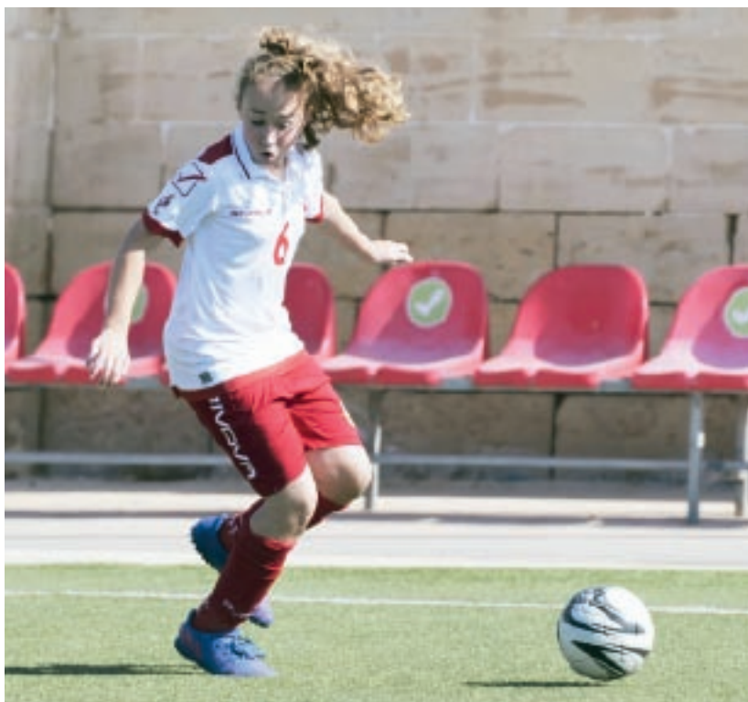
L-akkademja tal-bniet - proġett ieħor marbut mal-iżvilupp tal-plejers femminili.