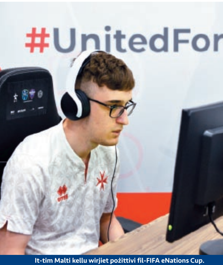
It-tim Malti kellu wirjiet pożittivi fil-FIFA eNations Cup.

L-edizzjoni ta' din is-sena saret minn Diċembru sa Mejju b'erba' stadji biex saru magħrufa ċ-champions tal-BOV ePremier League. Aktar minn 300 plejer ipparteċipaw fil-kwalifikazzjonijiet online biex jippruvaw isahħu posthom fil-faži ta' kwalifikazzjoni li saret fis-Centenary Stadium. Tnejn u tletin plejer ikkwalifikaw u ssieltu biex jikkonsolidaw posthom fost l-elite u jirrapprezentaw wieħed mit-timijiet tal-Premier League.