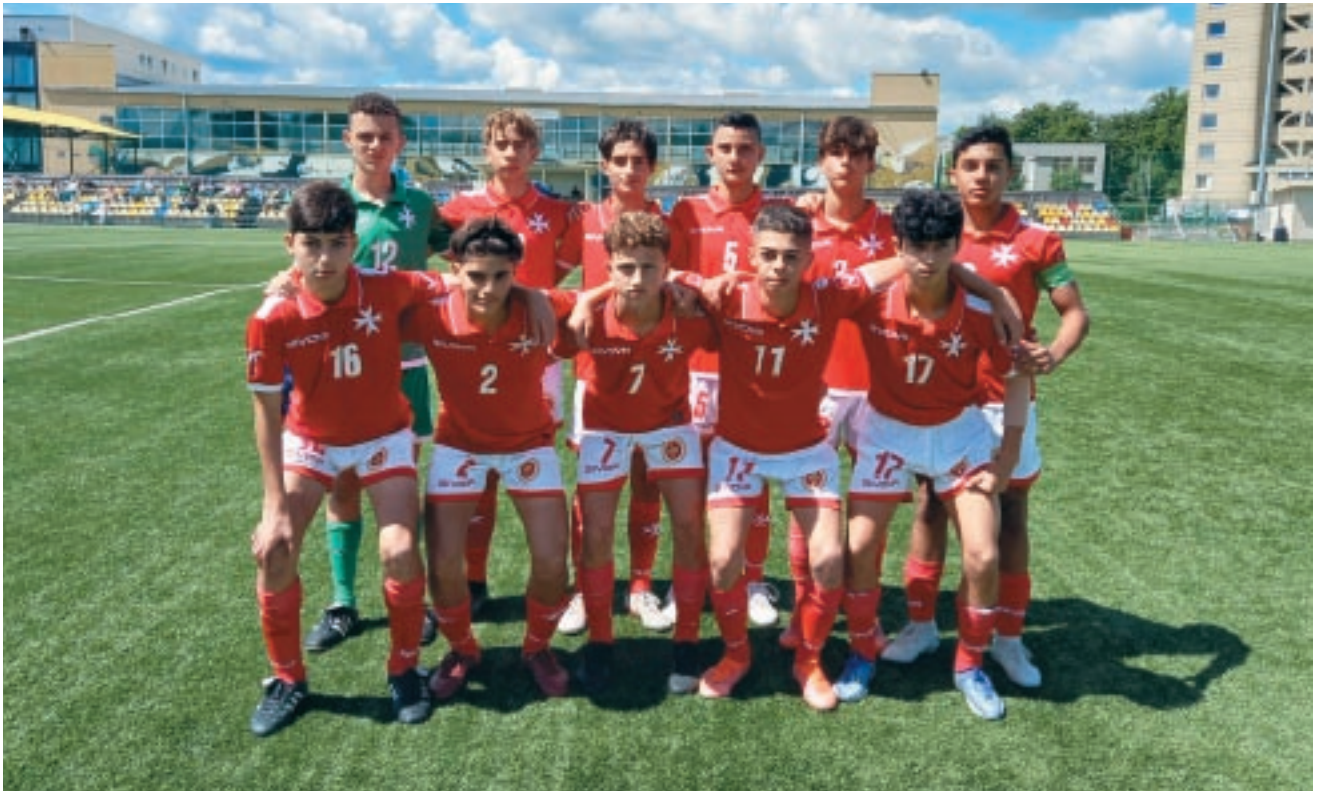
It-tim nazzjonali ta' taht l-14-il sena lagħab żewġ loġġbiet ta' ħbiberija kontra l-Litwanja f'Ġunju.