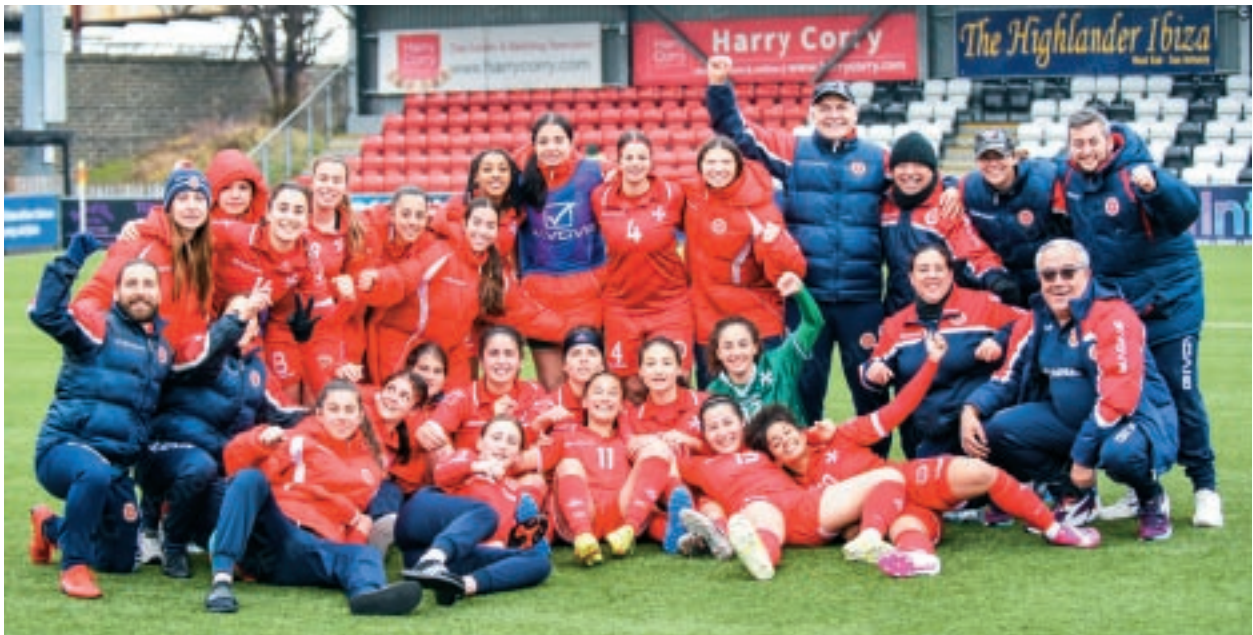
It-tim ta' taħt id-19-il sena jiċcelebra r-rebħa kontra l-Ġejjer Faroe li wasslet għall-promozzjoni f'League A.

L-ewwel round ta' kwalifikazzjoni sar f'pajjiżna f'Ottubru 2021 fejn it-tfajliet tagħna ma ħadu l-ebda punt kontra l-Iżrael (0-1), ir-Rumanija (2-5) u l-Ġorġja (0-1), biex b'hekk fit-tieni round Malta