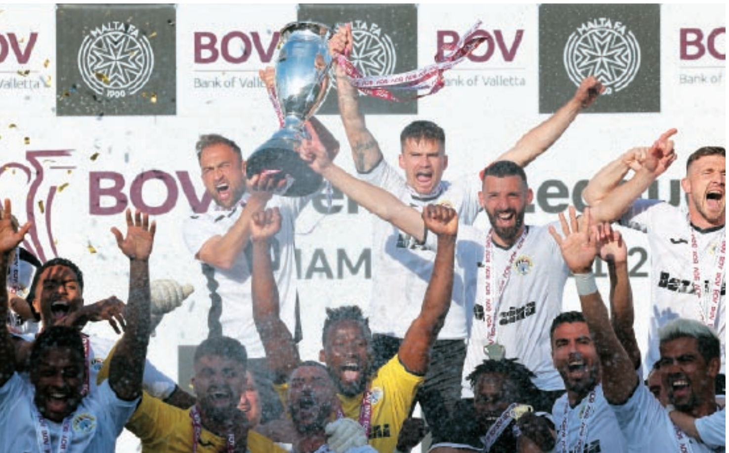
Hibernians rebħu l-Kampjonat BOV Premier, l-unur prinċipali fil-futbol Malti.