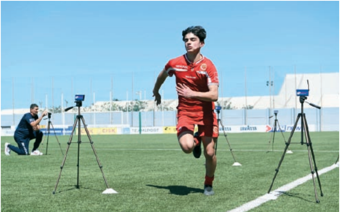
Il-Fitness Testing jirrappreżenta aspekk importanti ħafna fil-ħidma tad-Dipartiment tal-Performance.