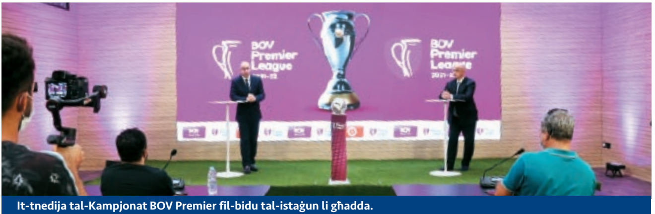
It-tnedija tal-Kampjonat BOV Premier fil-bidu tal-istaġun li għadda.

ritratti tal-prezentazzjoni lill-membri tal-media bħalma kien isir qabel.