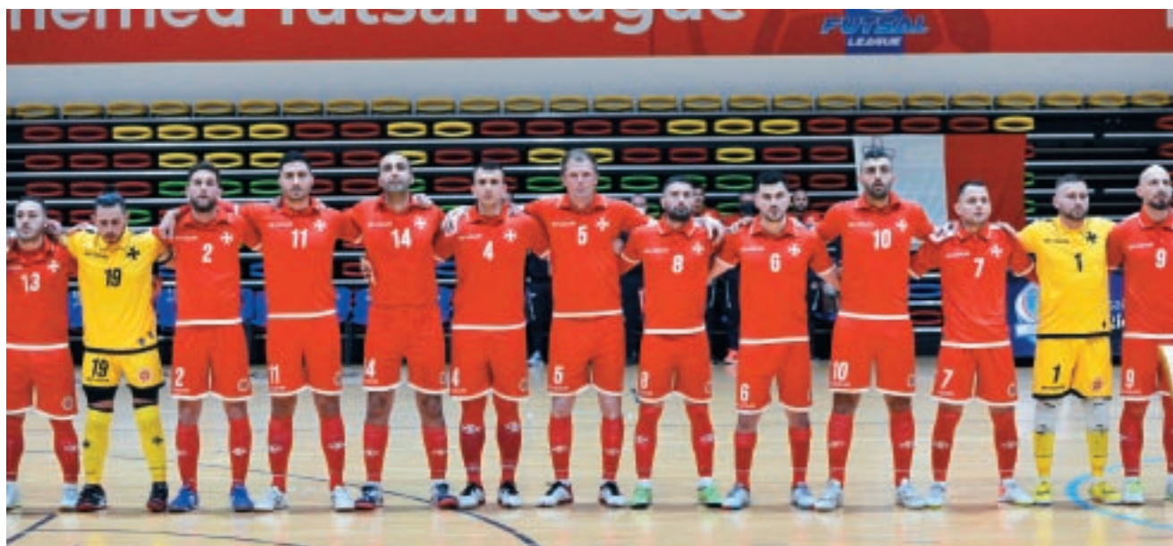
It-tim nazzjonali tal-futsal lagħab numru kbir ta' partiti matul l-istaġun 2021-22.