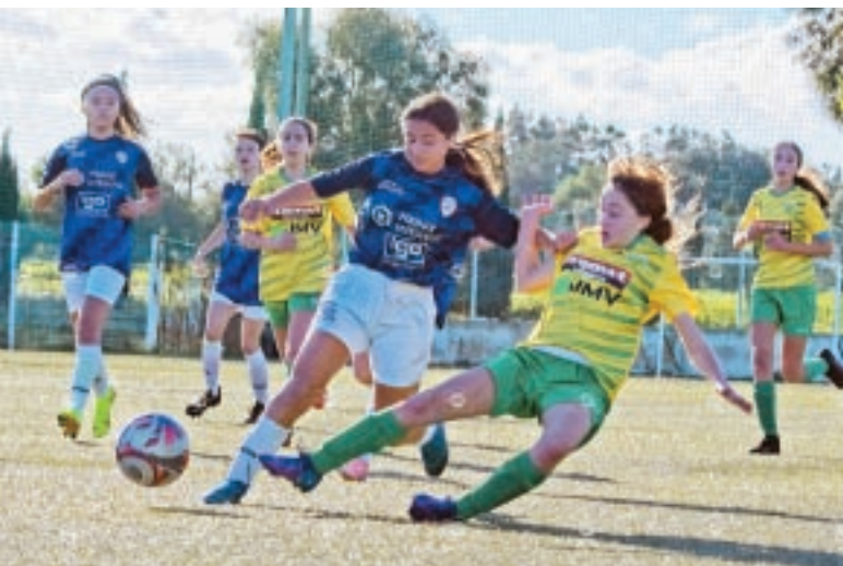
Azzjoni waqt il-kampjonat ta' taħt is-16-il sena.

Għall-ewwel darba f'dawn l-aħħar sentejn, dan il-kampjonat kien konkluż kif ippjanat fejn intlagħbu 56 partita u ġew skorjati 283 gowl bit-tim rebbieħ ikunu Birkirkara. Il-kompetizzjoni Knock-Out rat lil Swieqi United joħorgu rebbieħa fuq San Ġwann fil-finali.