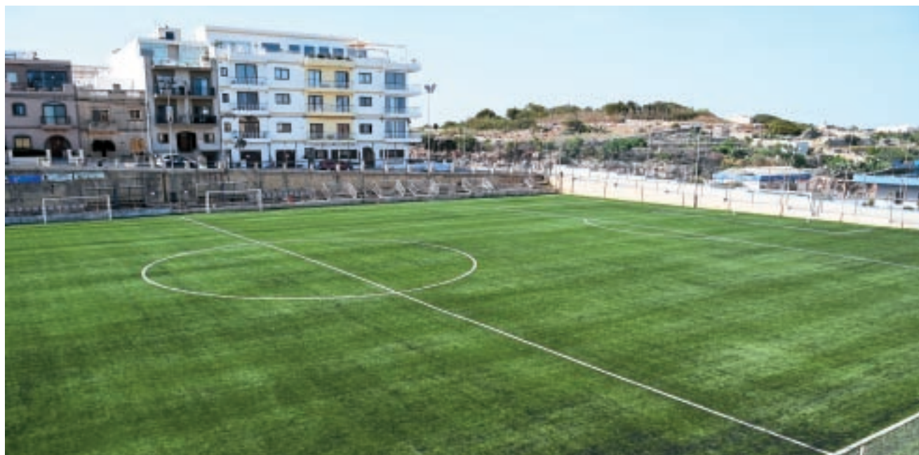
Dehra tal-pitch il-ġdid fil-faċilitajiet ta' Mellieħa Sports Club.

Matul l-aħħar sena wkoll, l-istess dipartiment kien involut f'diversi laqgħat u kien ukoll direttament responsabbli mill-proċess tas-sejha għall-offerti tal-proġetti msemmija. Permezz ta' dan id-dipartiment, l-Assoċjazzjoni qed tiżgura involviment akbar għal standards għoljin ta' kontabilità, governanza tajba, infrastruttura u investiment ta' kwalità għolja. ■