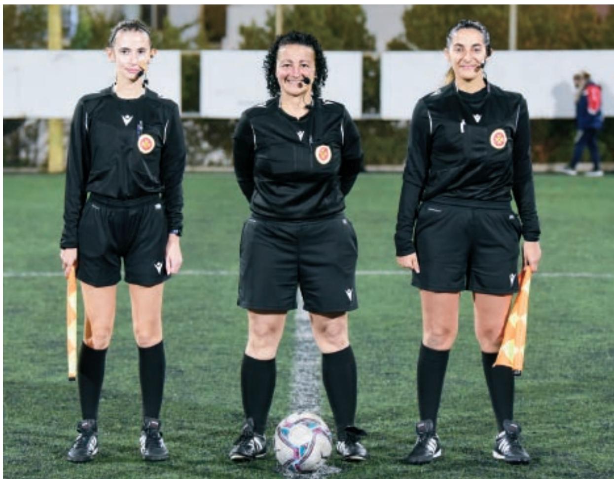
L-iżvilupp tal-uffiċjali tal-logħba femminili kompli jingħata importanza mill-Kumitat tar-Referees.