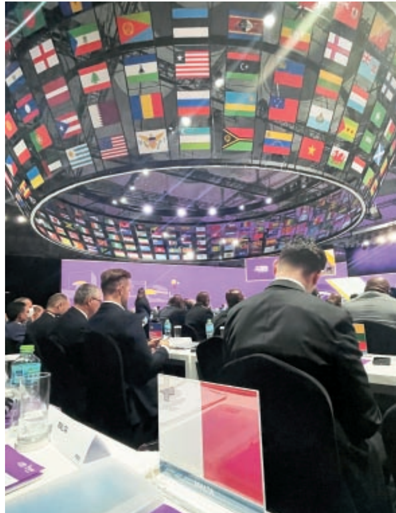
Uffiċjali tal-Malta FA attendew għall-kongressi tal-FIFA u l-UEFA li saru iktar kmieni din is-sena.

L-uffiċjali tal-Malta FA komplew bil-ħidma tagħhom biex isaħħu r-relazzjonijiet tajbin mal-imsieħba internazzjonali ewlenin, speċjalment il-FIFA u l-UEFA, u assoċjazzjonijiet nazzjonali fl-Ewropa u lil hinn.