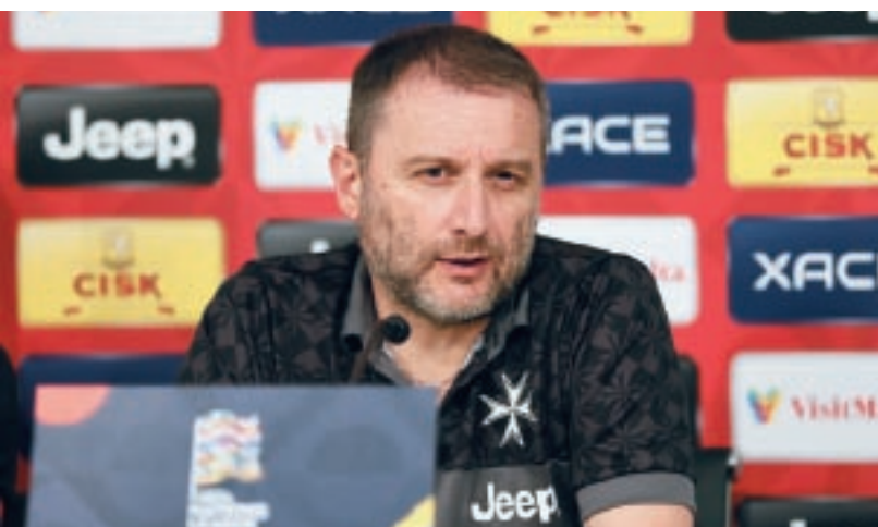
Devis Mangia, il-Head Coach tat-Timijiet Nazzjonali li jmexxi s-settur tekniku.

Il-Head Coach tat-Timijiet Nazzjonali jittama wkoll f'wirjiet eċċellenti mill-aqwa talenti tagħna, kemm fuq livell tat-tim nazzjonali kif ukoll fuq livell ta' klabbs, għaliex dan jista' jwassal biex iktar plejers Maltin jattiraw l-attenzjoni ta' klabbs importanti lil hinn minn xtutna. Biex inkomplu dan il-proċess li aktar plejers żgħażaġħ jilħqu l-livelli mixtieqa biex jilgħbu mat-timijiet nazzjonali, huwa importanti wkoll li dawn il-plejers jingħataw l-ispazju fl-ogħla kampjonati tal-futbol domestiku filwaqt li naħdmu biex nindirizzaw in-nuqqas ta' plejers Maltin f'pożizzjonijiet jew rwoli speċifiċi.