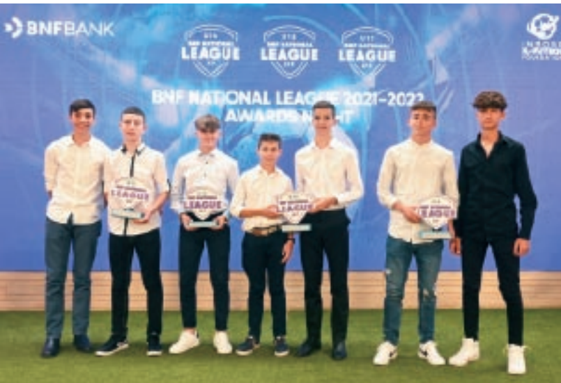
BNF Bank sar l-ewwel sponsor uffiċjali tal-kampjonati nazzjonali taż-żgħażgħ organizzati mill-Fondazzjoni Inħobb il-Futbol.