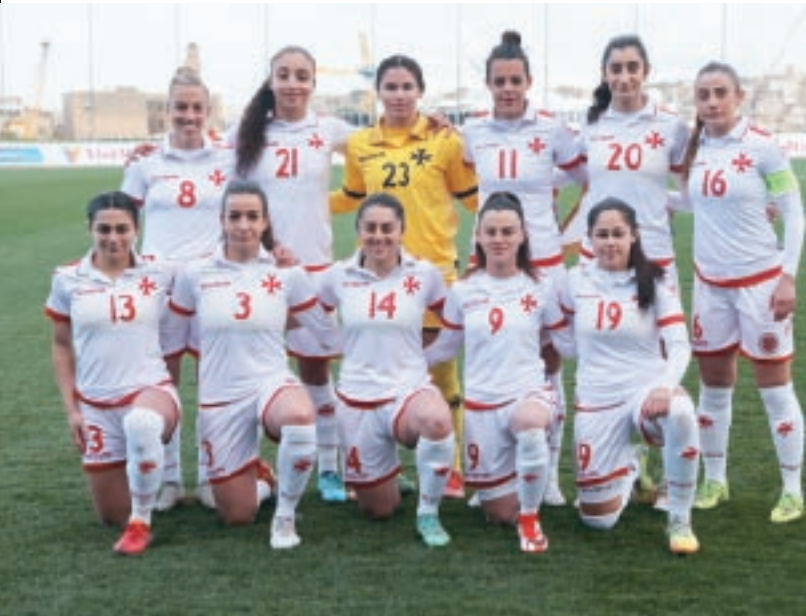
It-tim nazzjonali tan-nisa kien impenjat fi 12-il partita internazzjonali matul l-istaġun 2021-22.

Fil-grupp ta' kwalifikazzjoni, sal-aħħar partita li ntlagħbet f'April kontra d-Danimarka, it-tim Malti akkwista erba' punti (rebħa kontra l-Azerbajġan f'Novembru u draw mal-Bosnja Ħerżegovina f'Settembru). Il-partiti l-oħra kienu kontra d-Danimarka (Settembru 2021 u April 2022), ir-Russja