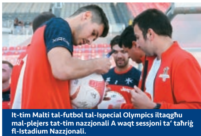
It-tim Malti tal-futbol tal-Special Olympics iltaqgħu mal-plejers tat-tim nazzjonali A waqt sessjoni ta' taħriġ fl-Istadium Nazzjonali.

Il-UEFA għażlet lill-Malta FA għal żewġ proġetti pilota - l-Outraged Project u l-UNITY EURO Cup. Il-proġett Outraged huwa bbażat fuq id-dokumentarju bl-istess isem bid-dipartiment tal-FSR jagħmel żjarat fl-iskejjel biex iwassal messagg b'saħħtu favur id-diversità u l-inklużjoni.