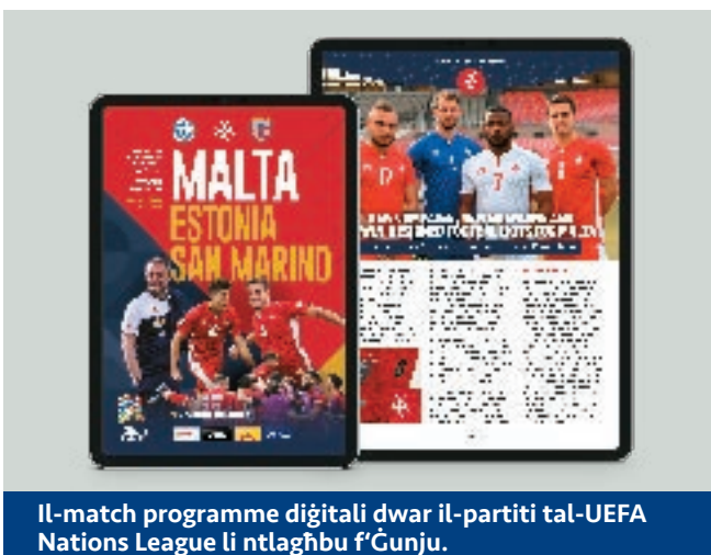
Il-match programme diġitali dwar il-partiti tal-UEFA Nations League li ntlagħbu f'Gunju.

Wara sena ta' ħidma tajjeb li wieħed iħares lura u jara x'sar tajjeb u x'sar ħażin, biex filwaqt li jkun sostnut it-tajjeb, il-ħażin jitranga. Id-dipartiment hu kommess li jkompli jxerred u jsib spazju biex is-soċjetà Maltija tkompli tisma' u tagħraf ix-xogħol kbir li jsir fi ħdan il-Malta Football Association. ■