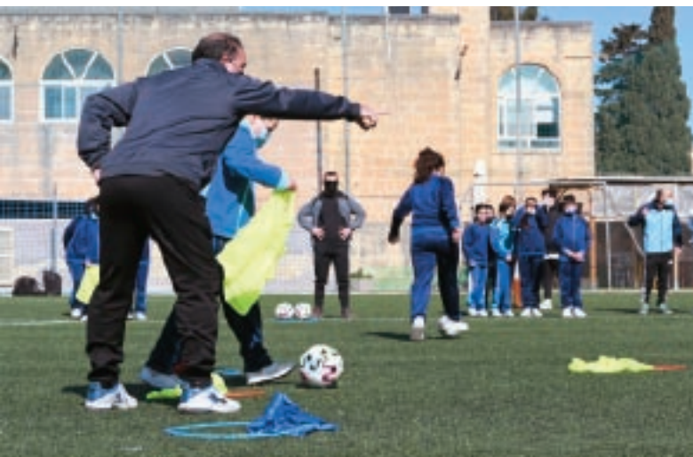
Sessjoni tal-Fun Fit Football fi skola primarja.