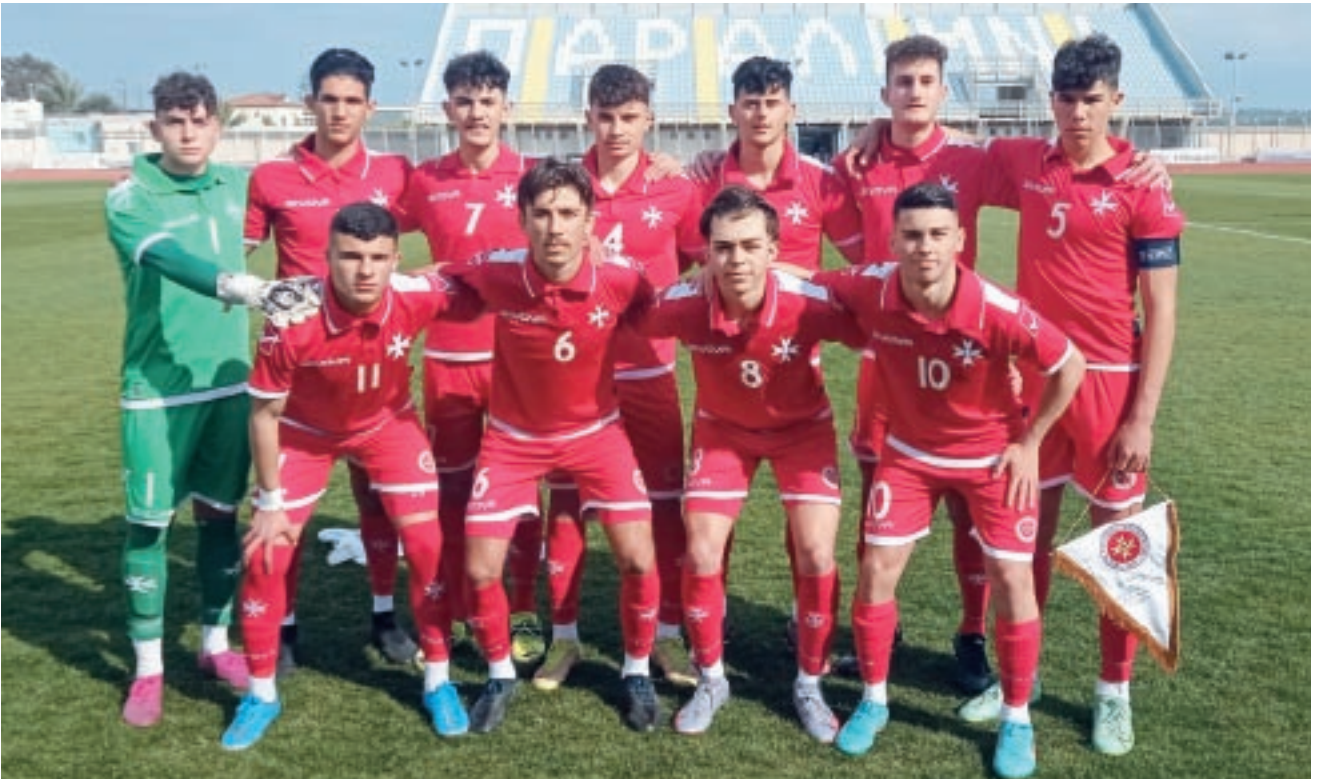
It-tim Malti ta' taħt it-18-il sena kien impenjat f'10 partiti ta' ħbiberija matul l-istaġun.

Marzu 2021 għaliex il-UEFA kienet għadha għaddejjja bil-konsiderazzjonijiet tagħha wara li l-pandemija tal-COVID-19 tellfet ħafna mill-ippjanar.