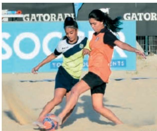
Sar tournament tal-beach soccer għat-timijiet tan-nisa taħt is-16-il sena.

B'kollox intlagħbu 46 partita u ġew skorjati 186 gowl. Birkirkara kisbu suċċess ieħor f'din il-kategorija