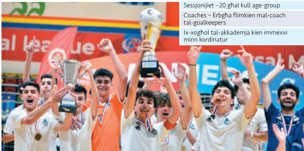
Sliema Wanderers rebħu l-Kampjonat Futsal U-16 wara li għelbu lil Mosta fil-finali.

59 total ta' partiti fil-Kampjonat Futsal U-16 2021-22