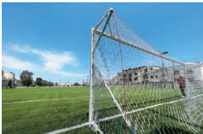
Aktar klabbs membri se jibbenefikaw mill-investiment fil-bdil tal-pitches matul l-istaġun li ġej.

L-Assoċjazzjoni bbenefikat ukoll minn fondi tal-programm UEFA Foundation for Children li ġew investiti fil-proġett ta' Dar San Ġuzepp kif ukoll minn fondi tal-Gvern Lokali, permezz tal-Aġenzija tal-Energija u l-Ilma, liema fondi ġew investiti f'sistema ta' arja kundizzjonata aktar effiċjenti fl-uffiċini tal-Assoċjazzjoni, b'investiment ta' ftit inqas minn €50,000.