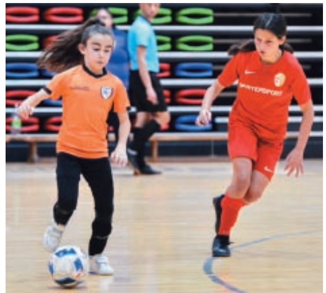
Azzjoni waqt il-Futsal Festival li sar fl-Iskola Nazzjonali tal-Isport.

Għal staġun ieħor, ġie adottat il-prinċipju tal-karta l-ħadra u dik ħamra biex il-bniet jiġihallaw jilagħbu f'ambjent ferrieħi u sabiex inhegħgu mgieba tajba u ta' rispettt mill-partitarji (kif ukoll mill-coaches) lejn it-tim u l-uffiċjali kollha waqt il-partiti.