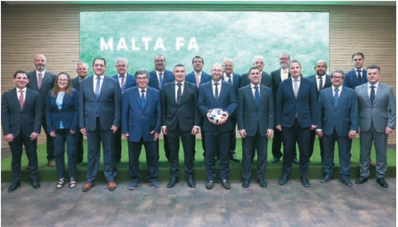
Il-Bord Eżekuttiv tal-Malta Football Association għall-istaġun 2021-22.

Saru diversi lagħat ukoll tal-Member Clubs Licensing Board, ir-Referees Committee, il-Coaches Licensing Committee, il-Youth & Grassroots Committee, il-Committee for Women’s Football, il-Medical Committee, is-Social Dialogue Committee u l-Ethics & Integrity Committee. ■