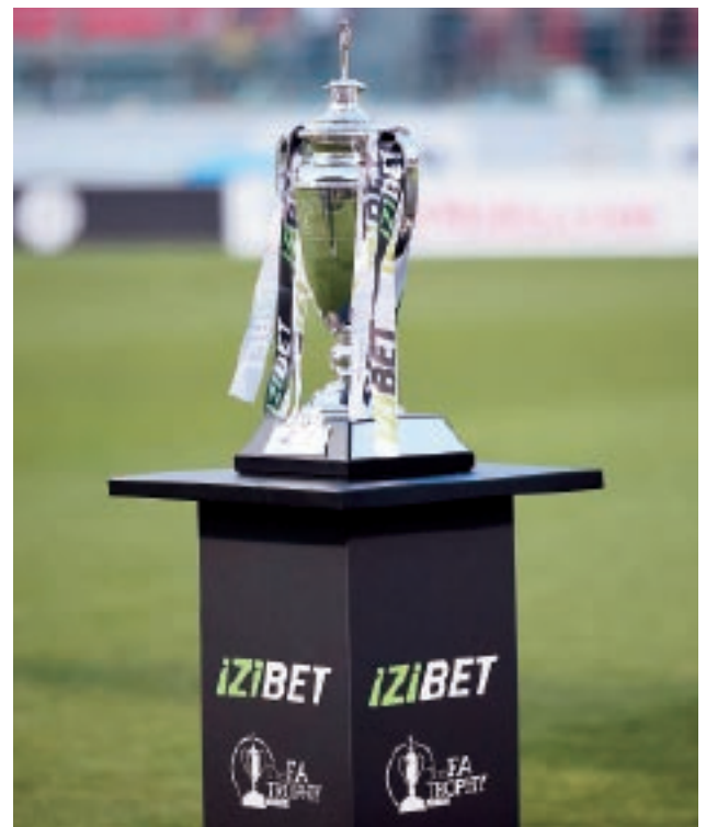
Il-finali tal-IZIBET FA Trophy, bejn Floriana u Valletta, attirat interess kbir.

Wara s-suċċess ta' dawn il-fan zones, il-Malta FA rreplikat dan il-kuncett qabel il-partiti mill-UEFA Nations League tat-tim nazzjonali A kontra l-Estonja u San Marino f'Ġunju, flimkien mal-organizzaturi tal-avvenimenti Sound Salon u s-South End Core. ■