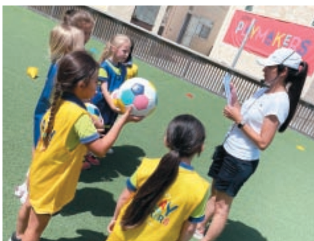
UEFA Playmakers - proġett immirat għall-bniet bejn il-ħames u t-tmien snin.

Fun Fit Football huwa mmirat li jagħti lill-istudenti fl-iskejjel primarji l-opportunità li jippruvaw il-futbol filwaqt li l-UEFA Playmakers jintroduci tfal bniet, bejn ħames u tmien snin, għal-logħba tal-futbol permezz ta' rakkont kulurit ibbażat fuq films ta' Disney.