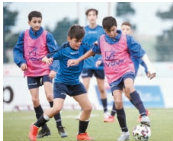
Il-proġett tar-Regional Football Hubs beda matul l-istaġun 2021-22.

Fl-aħħar ta' April ta' din is-sena, intaġħzlu 31 plejer biex jiffurmaw l-iskwadra nazzjonali ta' taħt l-14-il sena li lagħbu żewġ partiti ta' ħbiberija internazzjonali kontra l-Litwanja f'nofs Ġunju.