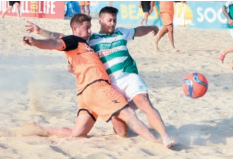
L-interest fil-beach soccer qed jikber b'mod kostanti.