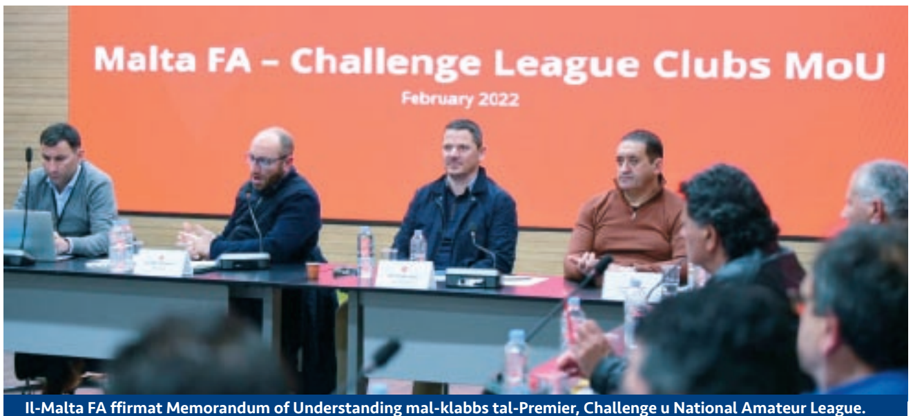
Il-Malta FA ffirmat Memorandum of Understanding mal-klabbs tal-Premier, Challenge u National Amateur League.

Il-MoU jkopri staġun u jmiss aspetti ta' rilevanza diretta għall-klabbs bħal ftehim dwar id-dati ewlenin tal-kalendarju tal-istaġun u aċċess għal numru ta' skemi ta' appoġġ li ġew ikkonfermati mill-ġdid. L-MoU ikopri tliet sezzjonijiet ewlenin - skemi tal-Malta FA, kalendarju u l-qafas regolatorju sportiv. ■