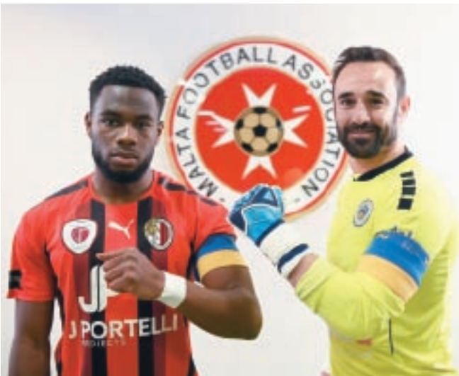
Inizjattivi ta' solidarjetà mal-poplu Ukren.

Id-Dipartiment tal-FSR qed jaħdem ukoll fuq il-proġett il-ġdid tal-UEFA ta' sostenibbiltà għall-2030, u aktar tard din is-sena se jiffinalizza strategija dwar il-valuri u l-għanijiet marbuta mar-responsabbiltà soċjali tal-futbol sal-2030.