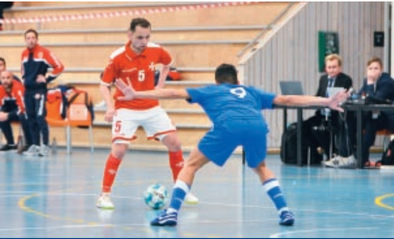
Malta rebhiet l-ewwel punt f'partita fil-fazi ta' kwalifikazzjoni għat-Tazza tad-Dinja wara draw ta' 2-2 kontra Ċipru.

L-iskwadra nazzjonali 2005 – Total ta' ħames kampijiet ta' taħriġ: