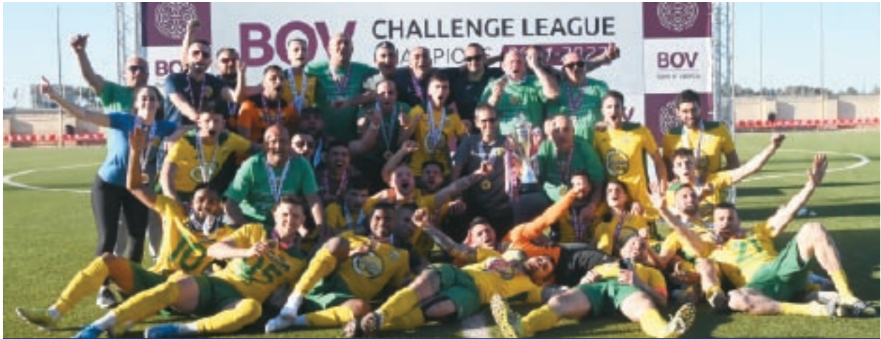
Żebbuġ Rangers - rebbieħa ta' Challenge League 2021-22.

Is-sitt timijiet li oriġinarjament tilfu posthom fiċ-Challenge League kienu Vittoriosa Stars, Rabat Ajax, St George's, Senglea Athletic, Mgarr United u Luqa St Andrew's. Minħabba li Santa Lucia mlew il-post vakant minn Pembroke Athleta fil-Kampjonat Premier u skont ir-regoli applikabbli f'sitwazzjonijiet bħal dawn, Vittoriosa Stars żammew posthom fiċ-Challenge League.