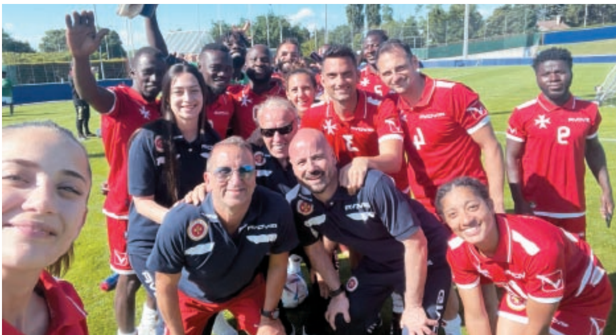
Malta kienet fost tmien nazzjonijiet li ħadu sehem fl-ewwel edizzjoni tal-UNITY EURO Cup, li saret f'Nyon.

Bħalissa għaddejja ħidma dwar il-ħolqien ta' programm FSR Assist għall-klubbs li se jippermettilhom jimpenjaw ruħhom mal-komunitajiet tagħhom u jöholqu opportunitajiet aħjar tal-futbol barra u fil-ground. ■