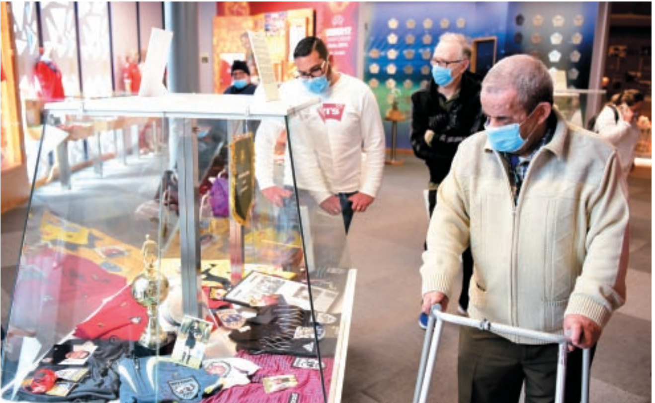
Anzjani jżuru l-Mużew tal-Futbol Malti grazzi għall-proġett #mytime.

Il-UNITY EURO Cup, li sar fil-kwartieri generali tal-UEFA f'Nyon lejn l-aħħar ta' Ġunju, ra l-partecipazzjoni ta' tmien nazzjonijiet Ewropew fosthom Malta permezz tal-Malta FA li għet