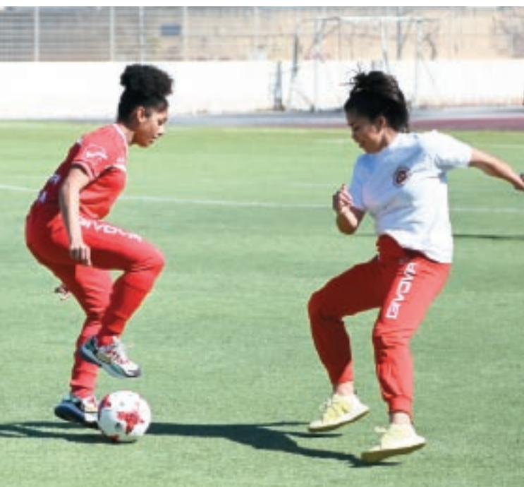
Saru diversi żjarat fl-iskejjel bħala parti mill-kampanja Outraged li tibgħat messaggġ b'saħħtu kontra r-razziżmu u favur id-diversità.