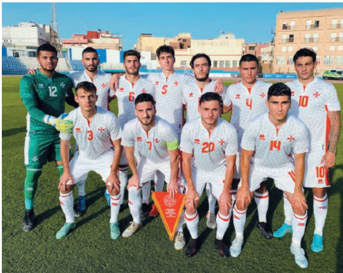
It-tim Malti ta' taht il-21 sena temm l-impenji tiegħu fil-grupp ta' kwalifikazzjoni b'total ta' sitt punti.

It-tim nazzjonali ta' taht id-19-il sena beda bit-taħriġ tiegħu (għall-plejers imwiilda fl-2003) f'Marzu 2021 sal-grupp ta' kwalifikazzjoni li ntlagħab fil-Polonja f'Ottubru 2021. Il-preparazzjonijiet ma bdewx qabel