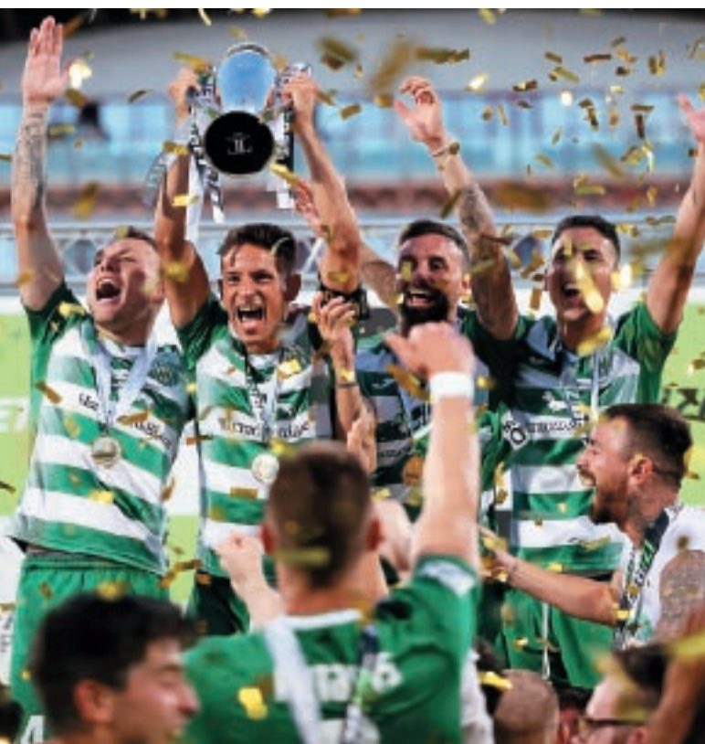
Floriana għelbu lir-rivali Valletta 2-1 fil-ħin barrani biex rebħu l-IZIBET FA Trophy.