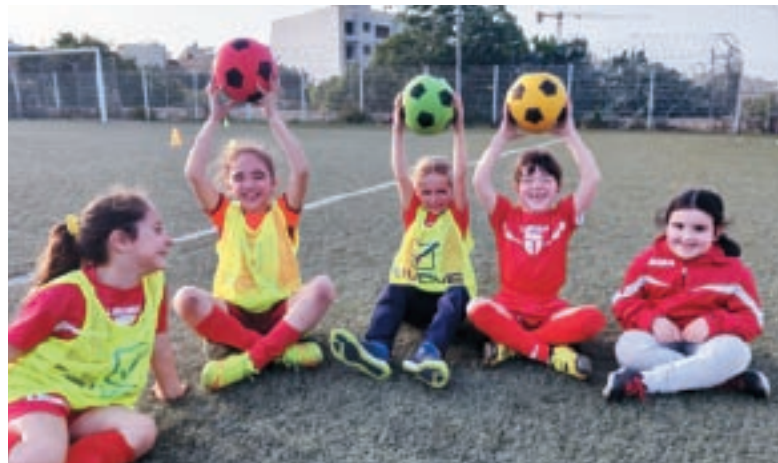
Komplet tingħata għajnuna lill-klabbs li għandhom timijiet tan-nisa.

Il-persuna responsabbli mill-media fi ħdan id-dipartiment jippublika artikli fuq is-sit ufficjali tal-Assoċjazzjoni, fosthom previews u reviews tal-kampjonat femminili, partiti tat-timijiet nazzjonali tagħna u rapporti dwar attivitajiet organizzati mid-dipartiment.