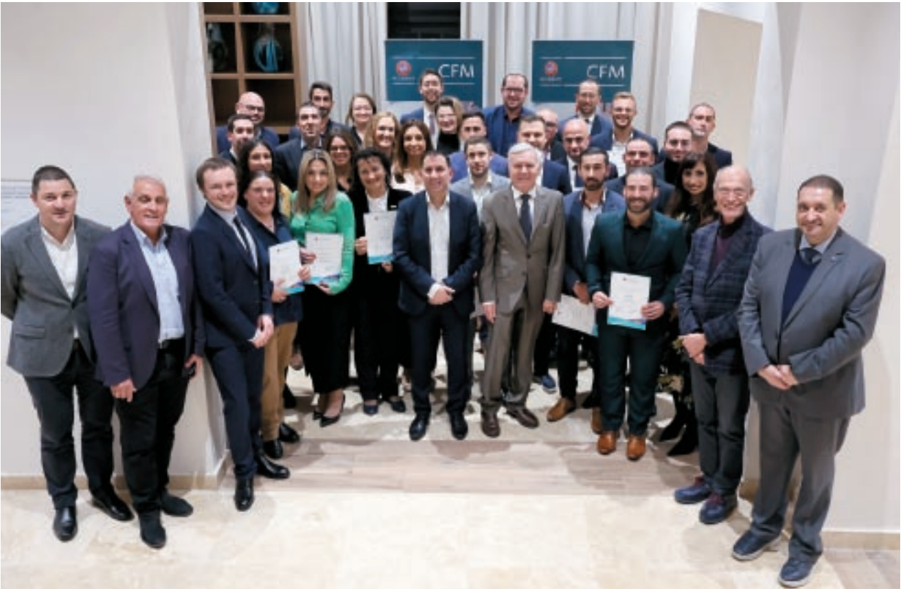
Il-Malta FA organizzat b'suċċess kors tal-UEFA Certificate in Football Management.

L-Assoċjazzjoni rnexxielha tikseb finanzjament sħiħ tal-UE għall-programmi ta' taħriġ rispettivi. Opportunitajiet oħra ta' żvilupp tal-impjegati ġew offruti lil numru ta' impjegati inkluż sponsors ta' programmi tekniċi speċjalizzati, UEFA Certificate in Football Management, seminars tal-UEFA Online, programmi ta' taħriġ dwar saħħa u sigurtà, u sessjonijiet ta' taħriġ fuq il-post tax-xogħol.