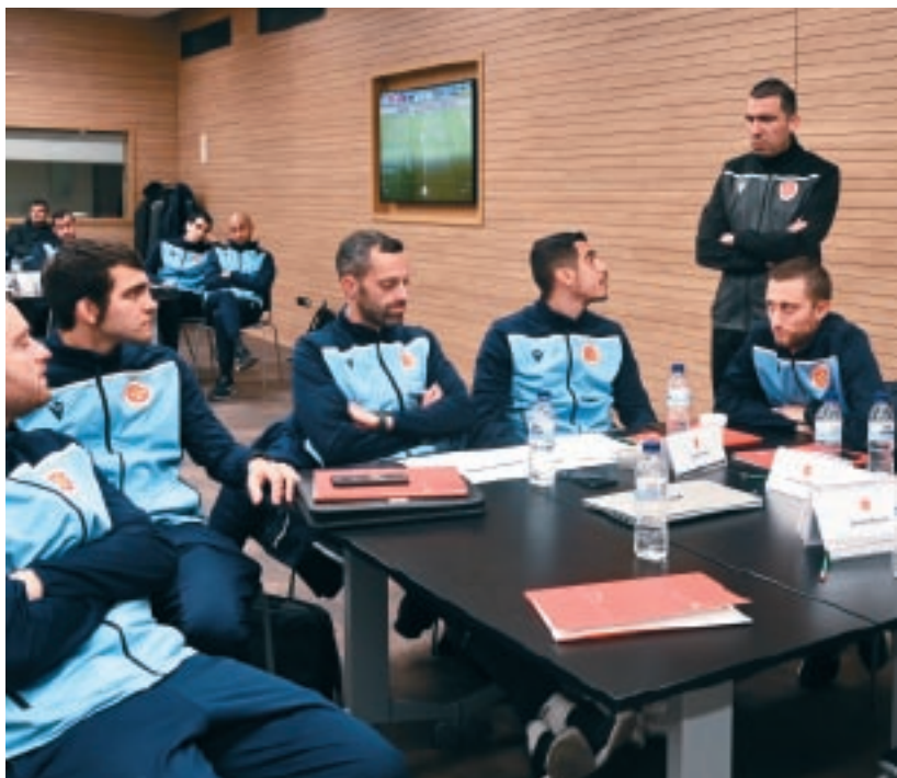
Wieħed mis-seminars li ġew organizzati b'mod regolari matul l-istaġun.

Ir-Referees Coach System introdotta fl-istaġun preċedenti kompliet tkun attiva u kull uffiċjal tal-logħba kellu punt ta' riferiment biex jgħinu/jgħinha fl-iżvilupp tal-karriera bil-Kumitat tar-Referees ikollu set-up li jiżgura li l-uffiċjali kollha jkunu qed jiġu segwiti.