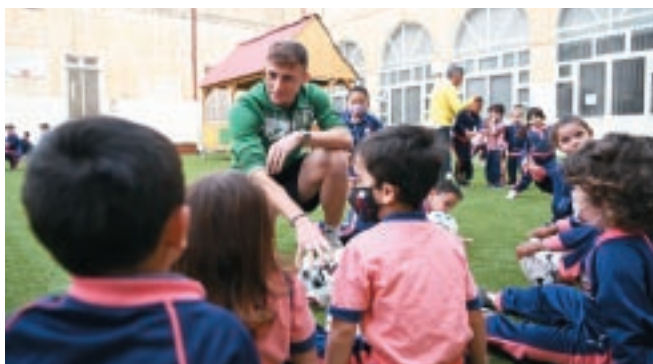
Qabel il-finali tal-IZIBET FA Trophy saret kampanja fl-iskejjel bit-trofew jittiehed fl-erba' skejjel fil-lokalitajiet tat-timijiet semi-finalisti.

It-tliet kampjonati kienu koperti ġimgħa b'ġimgħa b'artikli fuq il-website u posts fuq il-mezzi soċjali, bil-ħidma tintensifika hekk kif jinqalgħu attivitajiet speċifiċi bħall-kampanja Solidarity with Ukraine. Minbarra hekk, din is-sena t-tħabbira tal-Plejer u Coach tax-Xahar kienet strutturata aħjar b'video li jiżvela min hu r-rebbieħ, flimkien ma' artiklu fuq il-website, liema artiklu ntbaġħat flimkien ma'