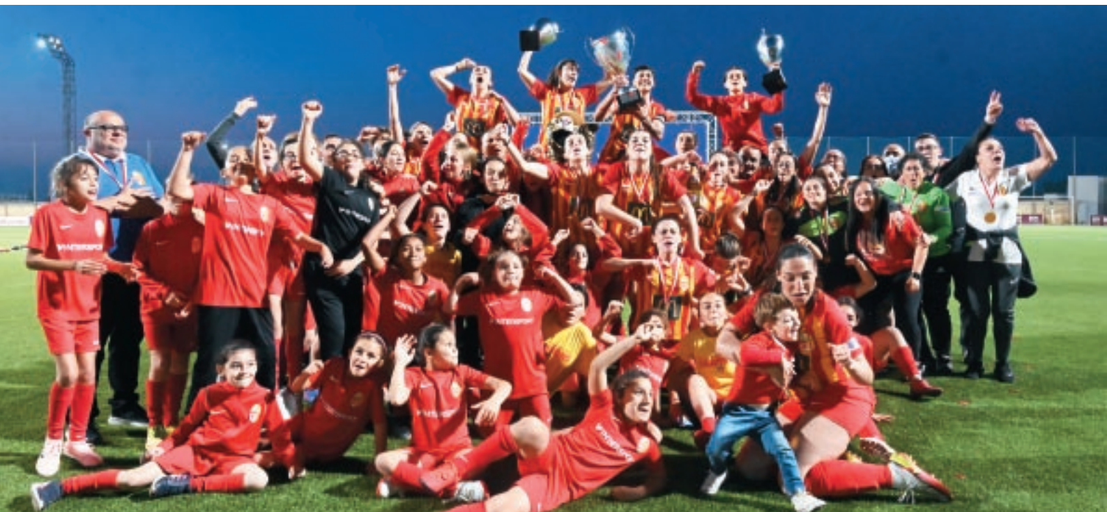
Staġun ieħor memorabbli għat-tim tan-nisa ta' Birkirkara li rebħu l-kampjonat u n-Knock-Out.