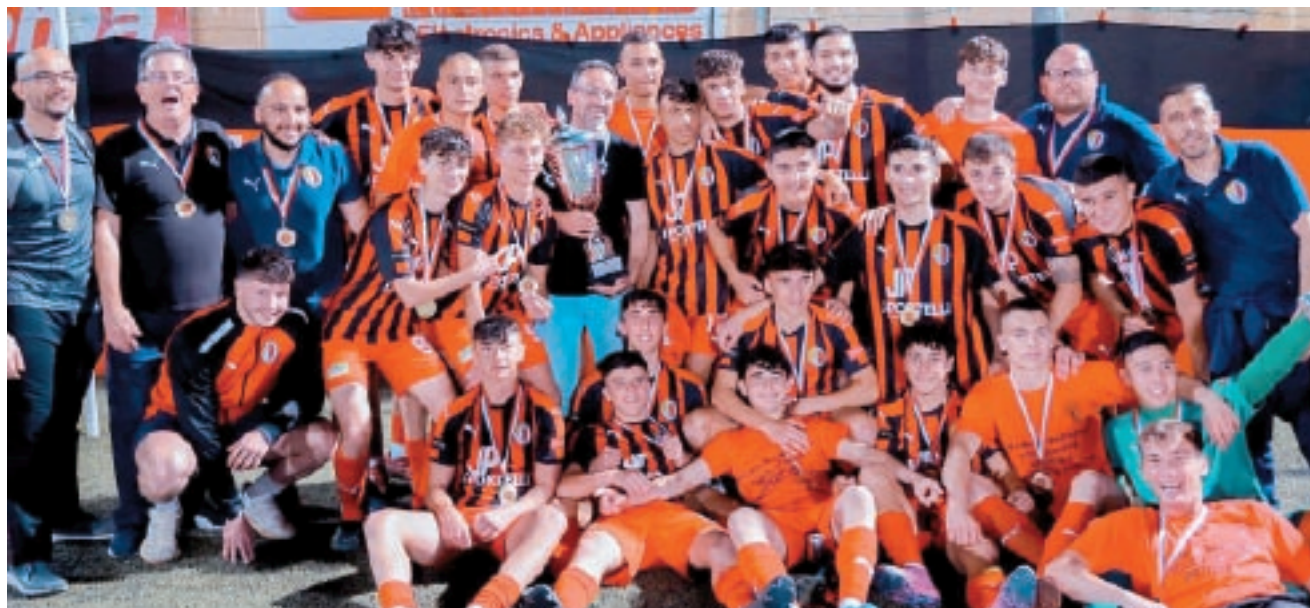
Ħamrun Spartans – rebbieħa tal-Kampjonat Nazzjonali tal-Youths.

Wara li ddominaw il-kampjonat u ġew inkurunati champions għall-10 darba fl-istorja tal-klabb, l-Istripes rebħu wkoll in-Knock-Out wara li għelbu lil Swieqi United 3-0 fil-finali. ■