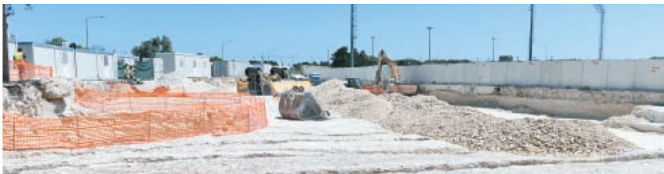
F'Marzu li għadda ngħata bidu għax-xogħol ta' skavar fit-sit fejn qed jinbena ċ-Ċentru Nazzjonali tal-Futbol f'Ta' Qali.

Wara l-investiment ta' żewġ miljun ewro fuq il-wiċċ ta' turf naturali ġdid fit-Training Grounds f'Ta' Qali, proġett li mhux biss tlesta fil-ħin iżda wkoll bil-budget ippjanat u b'viżjoni ċara, komplejna bil-ħidma fuq il-proġett ta' Ċentru