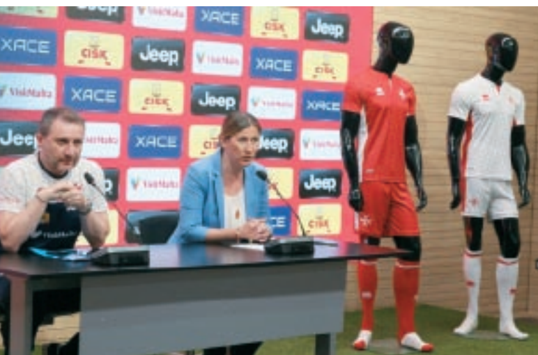
Waħda mill-konferenzi tal-aħbarijiet indirizzati minn Devis Mangia meta tissejjaħ l-iskwadra nazzjonali għall-partiti internazzjonali.