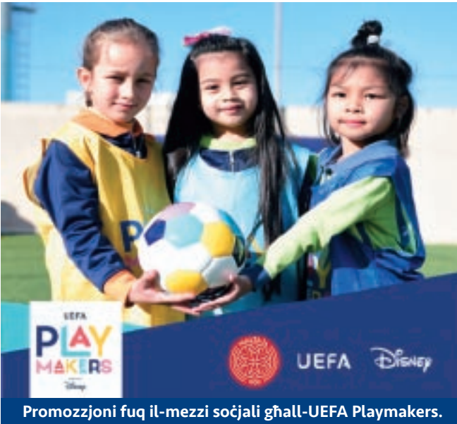
Promozzjoni fuq il-mezzi soċjali għall-UEFA Playmakers.

LSEs, għalliema, coaches, studenti tal-MCAST u plejers femminili wkoll.