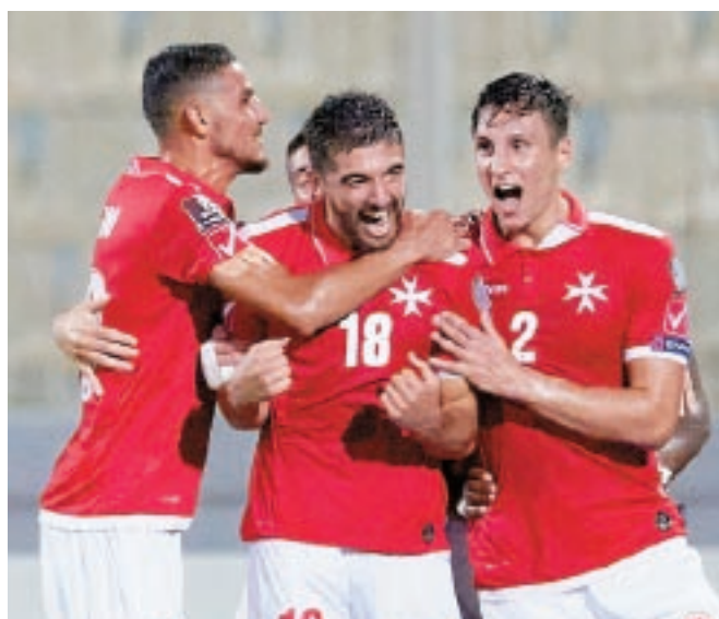
Plejers tat-timijiet nazzjonali qed jingħataw taħriġ dwar mental performance.

It-tim fdat bl-irwol delikat tal-mental performance tal-plejers ħadem ħafna matul l-istaġun ma' numru kbir ta' plejers li jirrapprezentaw lit-timijiet nazzjonali.