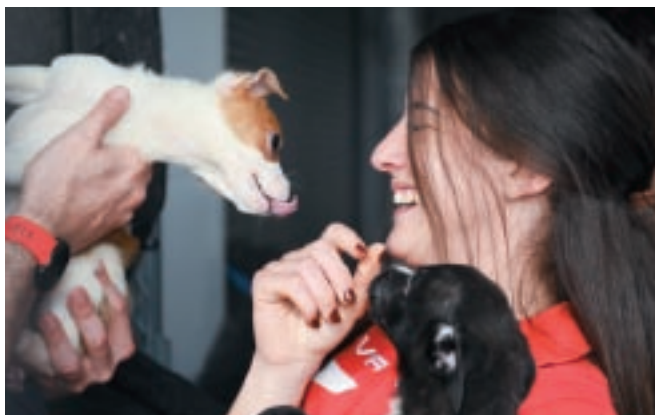
Membri tat-tim nazzjonali tan-nisa żaru l-Association for Abandoned Animals fi Frar f'attività ta' responsabbiltà soċjali.