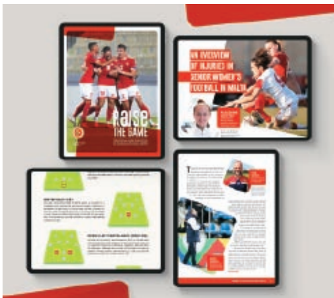
L-ewwel edizzjoni tar-rivista diġitali 'Raise The Game' intbagħtet lill-coaches kollha ċċertifikati mill-Malta FA f'Jannar li għadda.

Dan wassal biex il-Malta FA giet mistiedna tattendi seminars prattiċi lokali mogħtija minn lecturers fl-LJMU u student li attenda għal wieħed minn dawn is-seminars qatta' perjodu jaħdem mal-Malta FA bħala parti mill-placement relatat mal-kors. ■