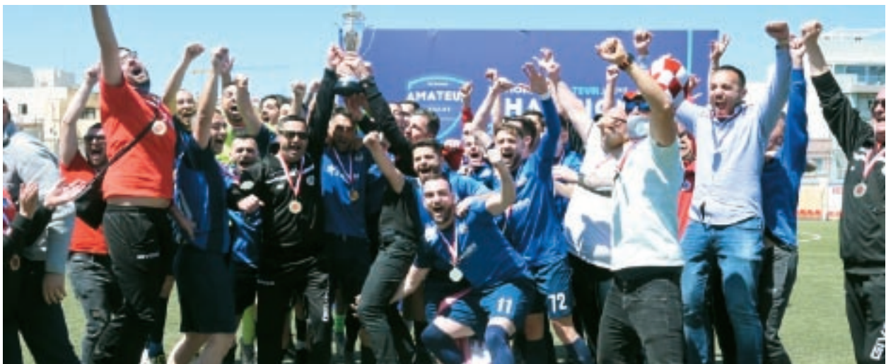
Żurrieq FC rebħu n-National-Amateur League 2021-22.

L-unuri prinċipali l-oħra f'din il-kategorija marru għand Żabbar St Patrick li rebħu n-National Amateur Cup u n-National Amateur Super Cup biex b'hekk pattew xi ftit għad-dizappunt li fallaw il-promozzjoni.