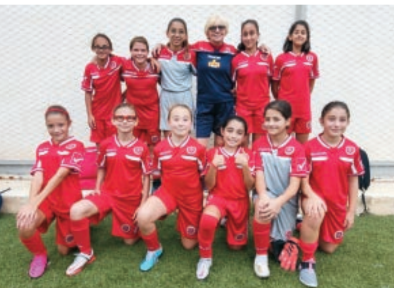
Uħud mill-bniet li jiffurmaw parti mill-Akkademja.

Sadanittant, l-akkademja kompliet bil-ħidma tagħha mal-bniet wara żewġ staġuni affetwati mill-pandemija. Dan il-grupp kien jitharreg darbtejn