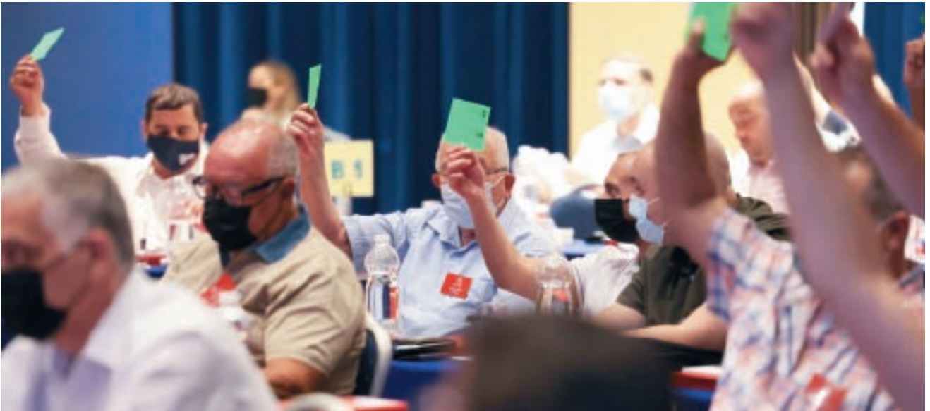
IL-GIDA, SWAN, Veterans Malta u l-MFPA ġew approvati bħala membri sħaħ tal-Malta FA waqt il-Laqgħa Ġenerali Annwali tal-2021.